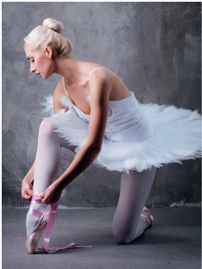
Getreu dem diesjährigen Motto „Primaballerina“ sollen im praktischen Teil des Wettbewerbs die Teilnehmer ihre Models in reizende Balletttänzerinnen verwandeln.

Für das Praxisthema „Primaballerina“ gibt es keine Kriterien – lasst Eurer Kreativität freien Lauf!